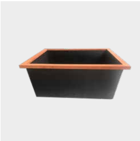
Vijver met oplegrand Corten Bassins avec bord en Corton Teich mit Kante auf Corten