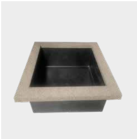
Vijver met oplegrand Rots Bassins avec bord en Rocher Teich mit Kante auf Fels