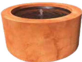
Watertafel rond in Corten Table d'eau ronde en Corten Wassertisch rund auf Corten

Verkrijgbaar in wit, zwart, cortenstaal-look, rots-look, en RAL. | Disponible en blanc, noir, corten, rock, et RAL. | Vefüigbar in weiß, schwarz, Corten, Rock, und RAL.