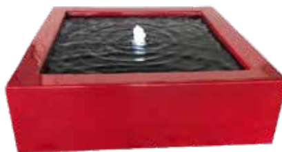
Watertafel in RAL Table d'eau en RAL Wassertisch RAL