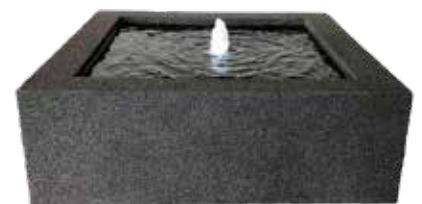
Watertafel in rots Table d'eau en Rocher Wassertisch auf Fels