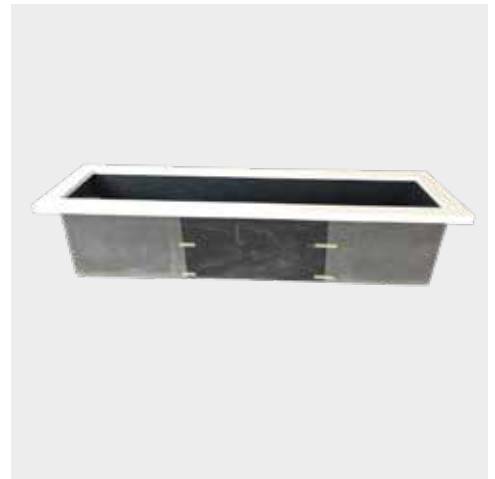
Vijver met oplegrand Wit Bassins avec bord en blanc Teich mit Kante Weiß